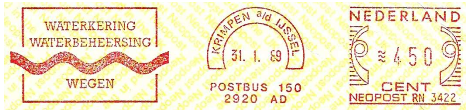
Afb. 342000 Frankeerstempel hoogheemraadschap van de Krimpenerwaard, Neopost RN 3422, Waterkering, Waterbeheersing, Wegen, Krimpen aan de IJssel 31/1/1989

Door de inwerkingtreding van de Wet verontreiniging oppervlaktewateren (WVO) van 1970 moest in principe de waterkwaliteitstaak aan de waterschappen worden overgedragen en de inliggende polders/waterschappen worden opgeheven en hun taken overgedragen aan het hoogheemraadschap. De provincie Zuid-Holland voelde evenwel niet voor een samengaan met de Lopikerwaard: een dergelijk Hoogheemraadschap zou te grootschalig worden en bovendien had men in Utrecht een andere kijk op waterkwaliteitszorg. In Utrecht wilde men dat door de provincie laten doen en in Zuid-Holland door de waterschappen. Ten derde zou een dergelijk Hoogheemraadschap over twee provincies zijn verdeeld.