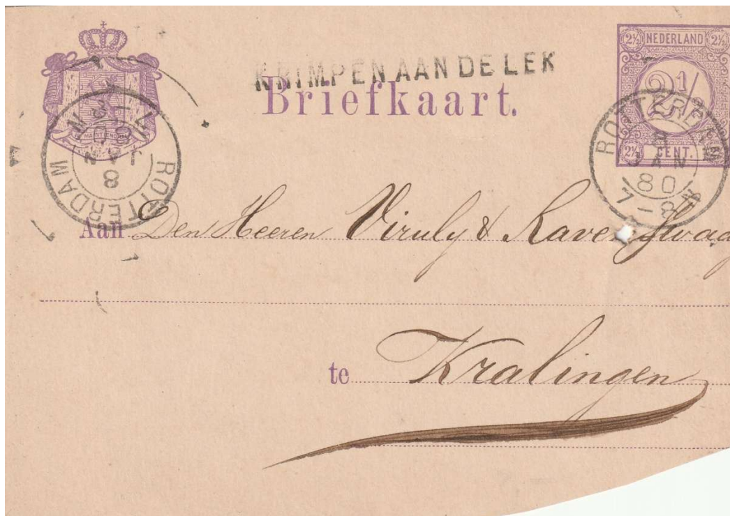
Afb. 598973 Briefkaart G3 2½ cent van Krimpen aan de Lek naar Kralingen met het naam- of langstempel KRIMPEN AAN DE LEK (PEP10248-02). Het hulppostkantoor Krimpen aan de Lek werd opgericht op 1/1/1859. Het hulppostkantoor behoorde tot het ressort van het postkantoor Rotterdam. Het getoonde langstempel grotesk lettertype was in gebruik van 20/4/1868 tot 26/11/1881 toen een kleinrond dagtekeningstempel werd verstrekt. De postzegel is ontwaard met kleinrond dagtekeningstempel Rotterdam 8/1/1880, 7-8N.

Het ambacht Krimpen aan de Lek voerde tussen 1805 en 1858 het gemeenschappelijk beheer over de polder Langeland en Kortland. Na de opheffing van het ambacht ging de polders als zelfstandige polder verder.