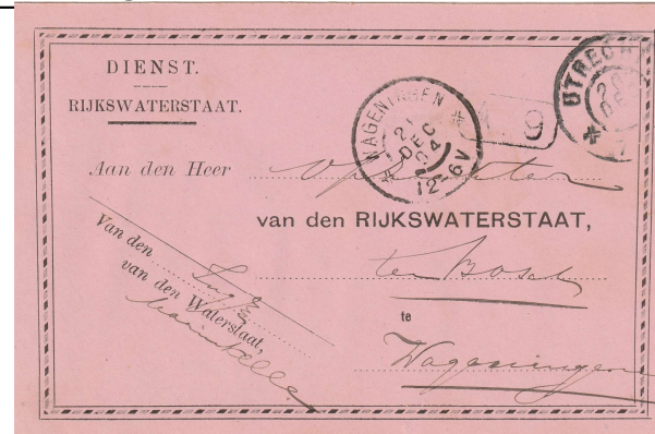
Met ingang van 1 mei 1903 werd de standplaats van Rhenen gewiozig in Wagenomgen